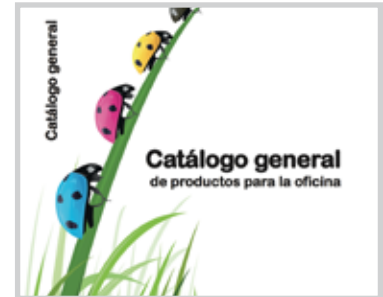
10 Catalogo General