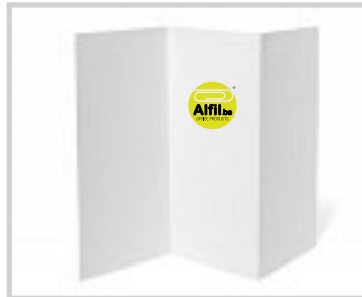
12.000 Folletos promocionales